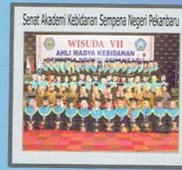
Senat Akademi Kebidanan Sempena Negeri Pelanggi