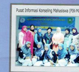
Pusat Informasi Konseling Mahasiswa (PIK-MA)