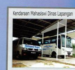
Kendaraan Mahasiswa Dinas Lapangan