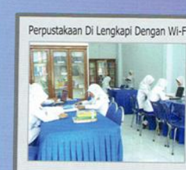
Perpustakaan Di Lengkapi Dengan Wi-Fi