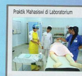
Praktik Mahasiswa di Laboratorium