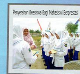
Penyerahan Beasiswa Bagi Mahasiswa Berprestasi