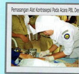
Pemasangan Alat Kontrasepsi Pada Acara PBL Desa