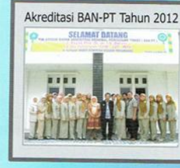
Akreditasi BAN-PT Tahun 2012