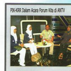
PIK-KRR Dalam Acara Forum Kita di ANTV