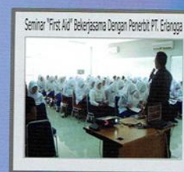
Seminar "First Aid" Bekerjasama Dengan Penerbit PT. Erlangga